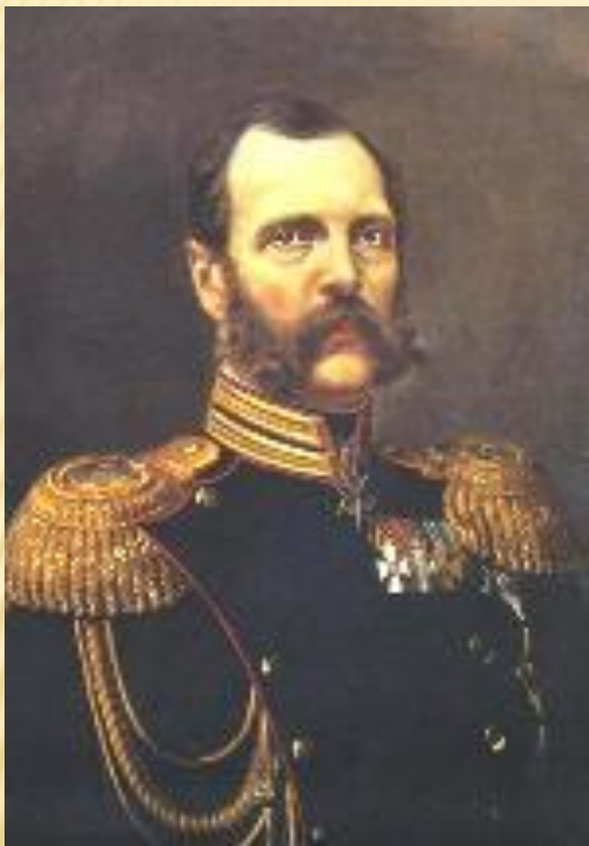
Император Александр II (1855 – 1881 )