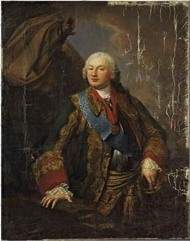
Волконский Михаил Никитич (9 [20] октября 1713—8 [19] декабря 1788)

«Троекуров <...> уважал Дубровского. Некогда были они товарищами по службе<...>. Обстоятельства разлучили их надолго. Дубровский с расстроенным состоянием принужден был выйти в отставку и поселиться в остальной своей деревне. Кирила Петрович, узнав о том, предлагал ему свое покровительство, но Дубровский благодарил его и остался беден и независим . Спустя несколько лет Троекуров, отставной генерал-аншеф , приехал в свое поместье; они свиделись и обрадовались друг другу.»